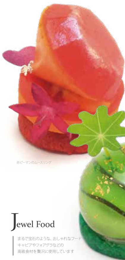
赤ピーマンのムースリング