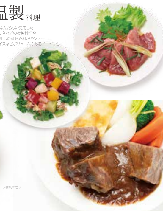
フォアグラのテリーヌ青梅の香り

旬の素材をふんだんに使用した サラダやマリネなどの冷製料理や 肉や魚を使用した煮込み料理やソテー ペンネやライスなどボリュームのあるメニューも